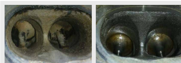
Ventiler før og efter rensning.